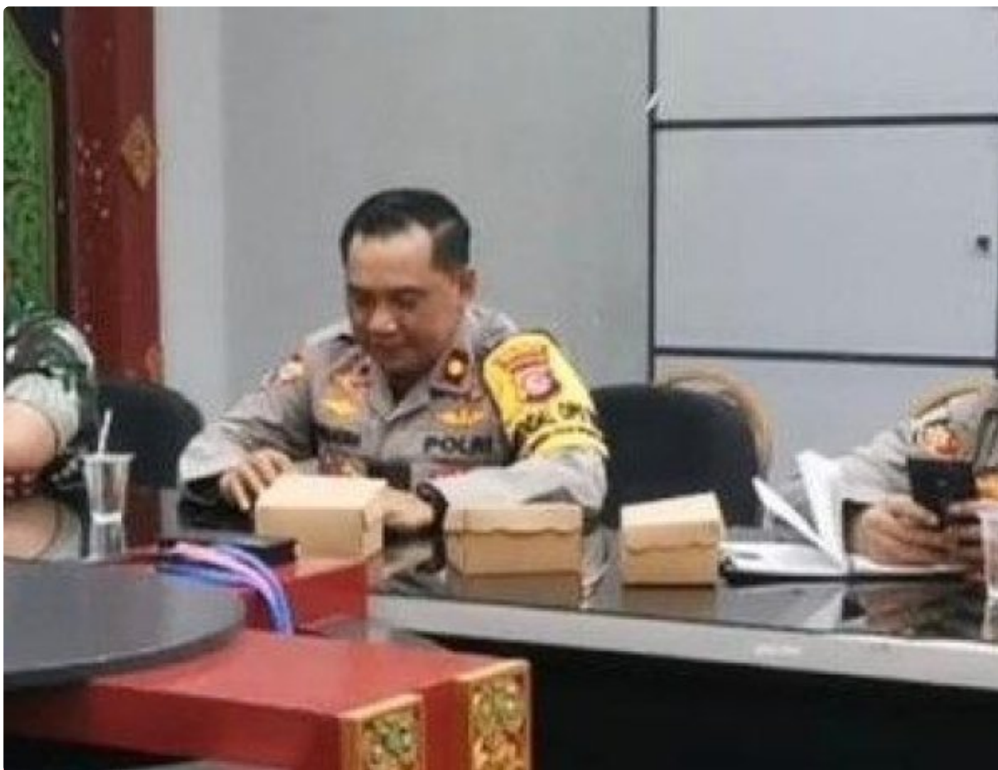
Kabagops Polresta Mataram saat menghadiri Rakor di Kantor Bupati Lombok Barat, Selasa (10/12/2024)